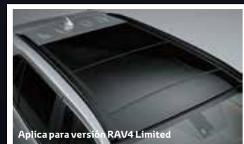
Aplica para versión RAV4 Limited