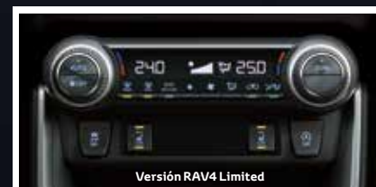
Versión RAV4 Limited

El aire acondicionado dual, con control de dos zonas ofrece un ajuste de temperatura independiente para los ocupantes. También cuenta con modo de eliminación de polen que permiten que todos se sientan más cómodos a bordo minimizando las impurezas del aire.