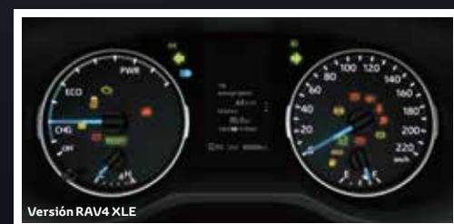
Versión RAV4 XLE

La nueva RAV4 cuenta con un tablero de instrumentos análogos con pantalla TFT central de multiinformación de 7" para la versión Limited y de 4.2" para la versión RAV4 XLE.