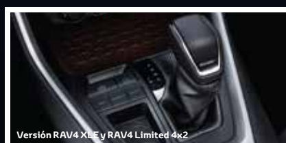
Versión RAV4 XLE y RAV4 Limited 4x2