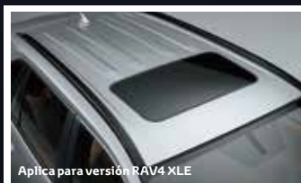
Aplica para versión RAV4 XLE

Disfruta la sensación de libertad que genera el sentir el viento y poder disfrutar de una noche estrellada con el techo panorámico en versión RAV4 Limited y techo corredizo en la versión RAV4 XLE el cual se puede ajustar en apertura total o parcial.