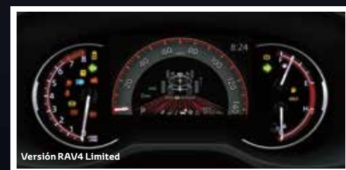
Versión RAV4 Limited